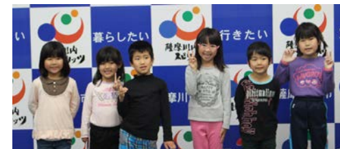
春の一日遠足でスマイル

お弁当は、市役所の会議室でお家の人が作ってくださった愛情たっぷりのお弁当をおいしくいただきました。雨の中でしたが、向田公園の休憩所でみんなとおやつ交換をもちました。おやつ交換がとても楽しい子供たちでした。貴重な体験ができた素敵な遠足になりました。