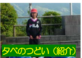
タベのつどい(紹介)

さ、その必要性、家族に対する感謝の心、そして自然の持つ優しさなど、たくさんのことを学んだ3日間でした。