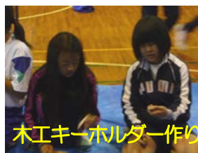
木工キーホルダー作り

2日目は、野外炊飯での朝食作りでしたが、前日の経験を生かしてさらにおいしいゆで卵が完成していたようでした。その後は、ウォークラリーを楽しみました。夜は平成中と4小との交流活動が行われ、各校の出し物や全員での自己紹介ゲームがあり和気あいあいとした心に残る楽しい交流になりました。その後のプラネタリウム鑑賞では、昼の疲れでうとうとする子ども…。そして、宿泊棟での就寝となりました。