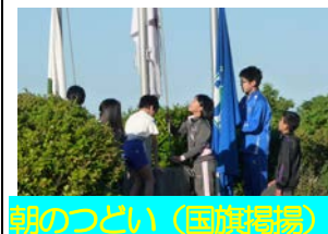
朝のつどい(国旗掲揚)

それぞれの活動を通して、規律ある集団行動から互いに信頼することや協力することの大切