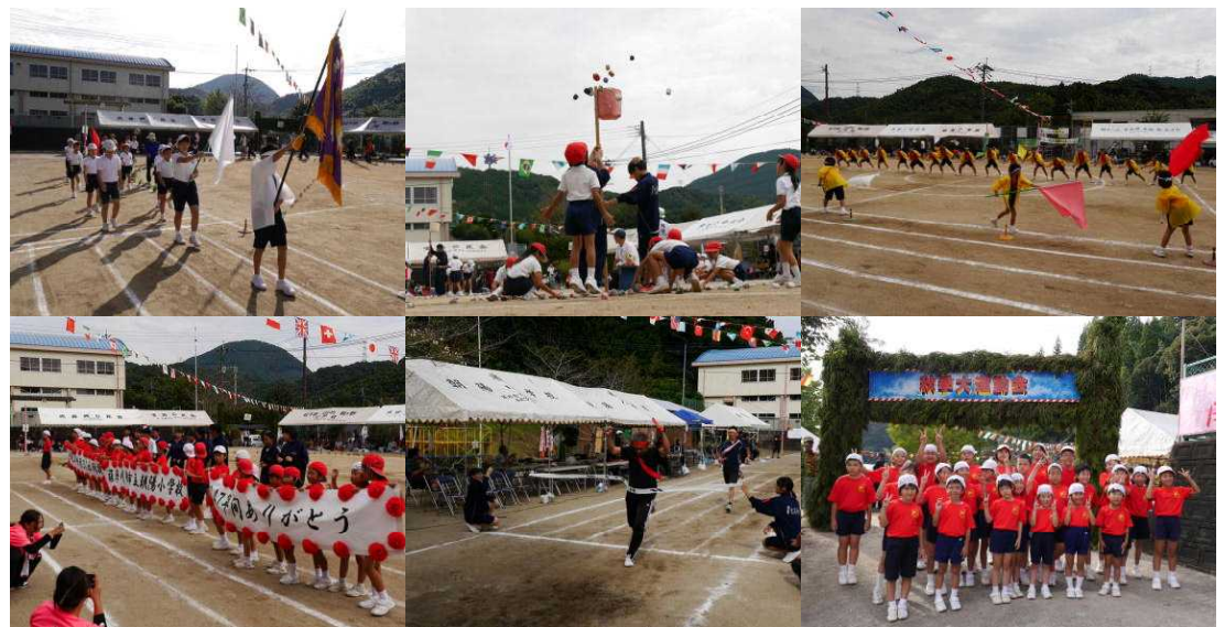
閉校記念秋季大運動会 ～御協力ありがとうございました～

朝夕は、めっきり肌寒さを感じるようになってきました。10月1日(日)は素晴らしい天気恵まれ、体協朝陽支部との合同「閉校記念秋季大運動会」が盛大に行われました。子どもたちは練習の成果を発揮しようと、全力で取り組んでくれました。練習ではまだ十分できていなかったところも、本番では完璧に披露することができました。特に応援団や歌等で大きな声が出ていて、やる気を感じました。一人ひとりの成長を感じてもらえたと思います。また、中学生も例年通り競技や運営にがんばってくれました。今年も、長寿会の皆様をはじめ地域・保護者の方々にグラウンドの除草や会場設営・緑門づくり・当日の運営・後始末まで御協力いただきました。閉会式後のドローンによる記念撮影やバルーンリリースも実施でき、子どもたちだけでなく、地域の皆様にとっても「心に残る」運動会になったと思います。 季節は秋になりました。先日の全校朝会でたくさんある「〇〇の秋」の中で「読書の秋」について話をしました。朝陽小学校では読書目標冊数を「低学年120冊、中学年100冊、高学年80冊」と設定しています。落ち着いて読書をすることはとても大切なことです。時には親子一緒に読書をしてみてはどうでしょうか。 さて、11月の第1週は「地域が育む『かごしまの教育』県民週間」です。1・2・6・7日は、自由に授業を参観していただくことができます。2日には学習発表会もあります。朝陽小学校最後の「県民週間」になります。ぜひ、学校においでください。 今年度も半分が過ぎ、朝陽小学校もあと6か月ということになりました。閉校記念行事等でお願ひすることが多々あるかと思ひますが、これからもよろしくお願ひいたします。