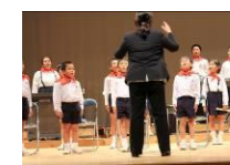
心を合わせて斉唱

11月2日(水)に、樋脇・東郷地域仲よし音楽会が開催されました。鳥丸小学校は全校で「マイ・バラード」を斉唱、「星に願いを」を合奏しました。1年生から6年生まで、心を一つにして歌声を響かせ、合奏のハーモニーを奏でました。丁寧な音楽づくりが大きく実を結んだ演奏でした。本校の特色ある教育活動の一つである全校器楽合奏の取組を通して、みんなで協力し努力することの大切さも学びました。