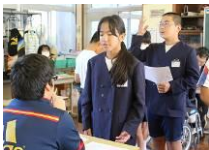
英語チャレンジの様子