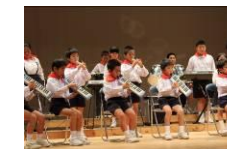
合奏もがんばりました