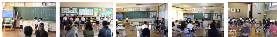
左から1年生、2年生、3・4年生、5・6年生の発表、全校斉唱・合奏、たくさんの参観ありがとうございました

11月4日(金)に学習発表dayを開催しました。国語科で学習した朗読劇・意見発表や全校音楽の様子を保護者や地域の方々に参観していただきました。1年生は「くじらぐも」、2年生は「お手紙」を動作もつけながら大きな声で発表できました。3・4年生は自分たちでまとめたことをくわしく発表できました。5・6年生は自分の考えを「意見文」にまとめ、分かりやすく伝えていました。たくさんの方の前での発表でしたが、みんないい体験ができました。また、全校斉唱・全校器楽合奏の発表もできました。保護者・地域の皆様方、来校いただきましてありがとうございました。今後も機会あるごとにぜひ学校に来ていただき、子どもたちの様子を見守ってくださいますようお願いいたします。