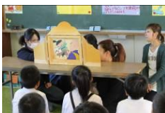
お母さん方、お上手でした

11月1日から30日まで、校内読書月間を実施しています。今年度も1か月間設定し、この期間は、図書委員会の先生方や児童が中心となって読書に関する様々な取組を行います。特にお母さん方や担任以外の先生の読み聞かせを子どもたちは楽しく聞いています。