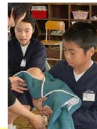
赤ちゃん重いなあ

11月20日（火）に、5・6年生を対象として自分の「いのち」について考える「いのちを育む性教育」を行いました。講師は助産師の山ノ内果（このみ）先生で、専門家の立場から、自分の「いのち」が大切に守られ育てられてきたことについて、分かりやすく、そして感動的に教えていただきました。子どもたちも命の大切さについて、改めて考えることができました。