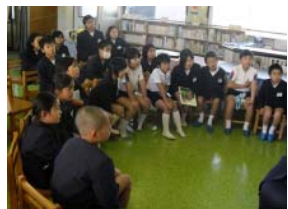
読み聞かせに聞き入る子どもたち

今後もさらに読書の習慣づくりのために、親子読書などの「家読（うちどく）」をよろしくお祈いします。