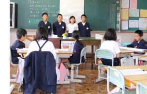
自分の意見を堂々と発表できました。