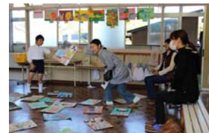
おうちの人と一緒に鳥丸カルタ

お忙しい中、たくさんの保護者・地域の皆様方に来校いただきありがとうございました。今後も機会あるごとにぜひ学校に来ていただき、子どもたちの様子を見てくださるようお願いいたします。