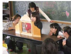
お母さん方や英語の先生による読み聞かせ