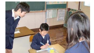
お箸を使って豆つかみ大会