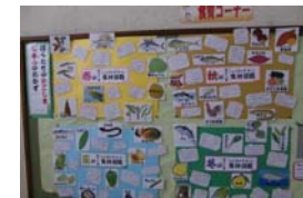
かごしまの食材あれこれ

学校給食に対する関心を高め、自分の健康管理や感謝の心を育むため、学校給食週間を設けました。この週間に保健給食委員会による「食」に関するクイズや本の読み聞かせ、全校児童とのふれあい給食等に取り組みました。また、給食にはかごしまの郷土料理等が取り入れられ、おいしくいただきました。