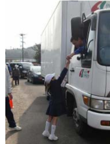
安全運転をお願いします

12月22日(金)に、高齢者クラブや薩摩川内警察署の方々と交通安全キャンペーンを行いました。子どもたちが書いた交通安全を呼び掛ける手紙や交通安全のちらし、手作りのお守りなどを運転手さんに手渡しました。