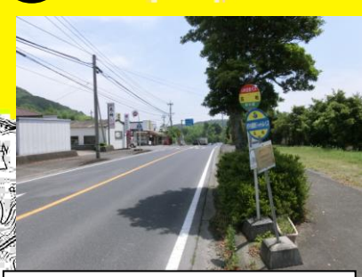
見通しの悪く信号機のない横断歩道で，交通量が多く危険である。