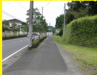
東郷小下からの自転車通学路，登下校時，小学生との接触の危険がある。注意が必要。