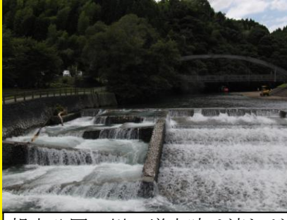
親水公園の川，増水時は流れが速く危険，また，夜は人通りが少なく不審者に注意が必要