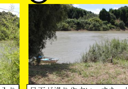
足下が滑りやすい。また，川岸は急に深くなっている。付近には同じような危険箇所が点在