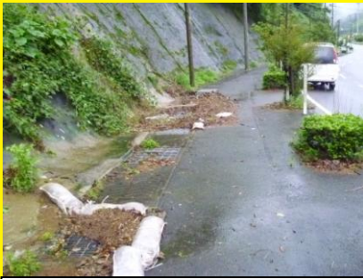
藤川付近の通学路，大雨時は山肌から小石が落下し通行に注意が必要