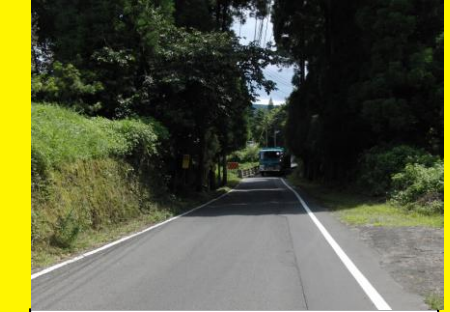
県道344号浦田橋付近，道路幅が急に狭くなり，通行に注意が必要。