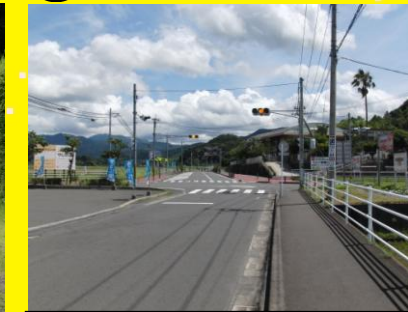
東郷小近くの交差点，交通量が多く，登下校中は小学生も多く注意が必要