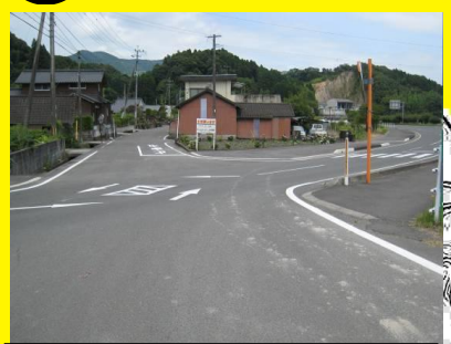
親水公園入口付近の道路，見通しが悪く，時間帯によっては交通量が非常に多く危険