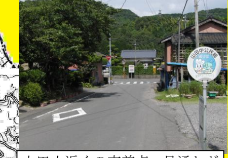
山田小近くの交差点，見通しが悪い。自転車では一旦停止しないと危険