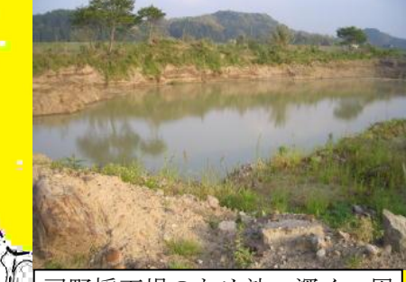
司野採石場のため池，深く，周辺が草に覆われているため近づくと危険