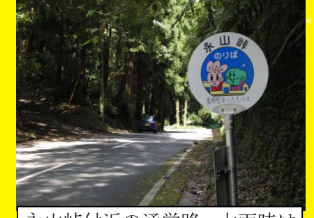
永山峠付近の通学路，大雨時は山肌から小石が落下し通行に注意が必要。