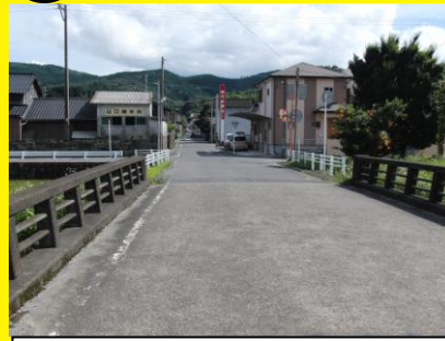
鹿児島銀行近くの交差点，見通しが悪く，通行や飛び出しに注意が必要