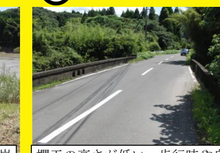
欄干の高さが低い，歩行時や自転車運転中の落下の危険がある。通行に注意が必要