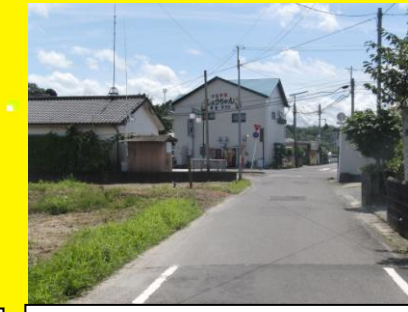
しょうちゃん横の交差点，見通しが悪く，通行や飛び出しに注意が必要