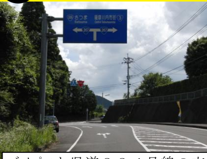
バイパスと県道334号線の交差点，県道から停止ラインをこえる自動車があり危険