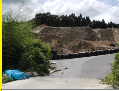
尖野のシラス採取場，崩れやすく近づくと危険，付近には同じような採取場が点在