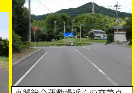
東郷総合運動場近くの交差点，見通しが悪く，自動車もスピードが出しやすく危険