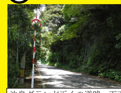
池島グランド近くの道路，雨天時は崖崩れの危険がある。通行に注意が必要