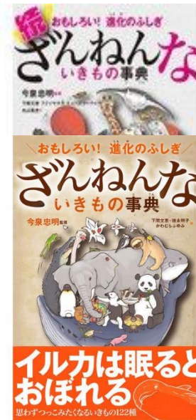
『ざんねないきもの事典』 いまいまみたあき かんしゅう たかはししよてん 今泉忠明 監修/高橋書店

三びきのこねずみたちがおひるねから目をさますと、目のまえにおおきなねこ。「ちゅーちゅー」びっくりした三びきがひめいをあげると、ねこは・・・。 主人公はネコとネズミ。どんなストーリーが展開されるのかは読んでからの楽しみ！ 読んだ後に心があったかくなるお話です。