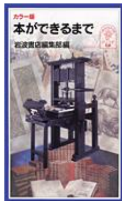
『カラー版 本ができるまで』 岩波書店編集部 編/岩波書店

読書のすすめ(おすすめ)に耳(みみ)にタコ(たこ)ができそうみなさん。それはさておき、一緒に本(ほん)作りの歴史(れきし)を調べ、印刷(いんさつ)、製本(せいほん)の現場(げんば)を訪ね(たず)ねてみませんか。本(ほん)は広い世界(せかい)を歩く(ある)ためのもっとも便利(べんり)で、ときには危険(きけん)なガイド(ガイド)なのです。