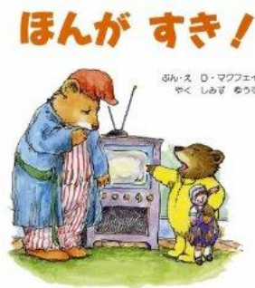
『ほんがすき!』 D・マクヱイル 文絵/アリス館

ある日(ひ)、ま(ま)ち(ち)の図(ず)書(しょ)館(かん)にライオン(らいおん)が(が)入(い)っ(っ)て(て)き(き)ま(ま)し(し)た(た)。み(み)ん(ん)な(な)大(だい)あ(あ)わ(わ)て(て)! (でも)メリウエザ(メリウエザ)館(かん)長(ちやう)は、静(しず)か(か)に(に)お(お)行(ぎやう)儀(ぎ)よ(よ)く(く)で(で)き(き)る(る)の(の)ら(ら)来(き)て(て)い(い)い(い)です(す)よ(よ)、と(と)い(い)ま(ま)し(し)た(た)。心(こころ)や(や)さ(さ)しいライオン(らいおん)は、す(す)ぐ(ぐ)に(に)み(み)ん(ん)な(な)と(と)仲(な)良(よ)し(し)に(に)。と(と)こ(こ)ろ(ろ)が(が)あ(あ)る(る)日(ひ)…。