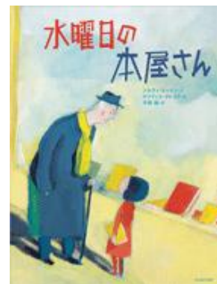
『水曜日の本屋さん』 リウイ・ネマツ 文/光村教育図書

クマ(こ)の子(こ)エ(エ)ン(ン)マ(マ)は(は)テ(テ)レ(レ)ビ(ビ)が(が)大(だい)好(こう)き(き)。でも、あ(あ)る(ある)朝(あさ)テ(テ)レ(レ)ビ(ビ)が(が)う(う)つ(つ)ら(ら)な(な)い(い)の(の)です(す)! 泣(な)き(き)わ(わ)め(め)く(く)エ(エ)ン(ン)マ(マ)を(を)、お(お)父(ちち)さん(さん)と(と)お(お)母(はは)さん(さん)は(は)な(な)だ(だ)め(め)よ(よ)う(う)と(と)し(し)ま(ま)し(し)た(た)が(が)…。