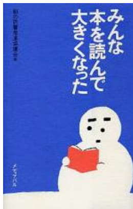
『みんな本を読んで大きくなった』 朝の読書推進協議会 編/メディアパル

読書のすすめ(おすすめ)に耳(みみ)にタコ(たこ)ができそうみなさん。それはさておき、一緒に本(ほん)作りの歴史(れきし)を調べ、印刷(いんさつ)、製本(せいほん)の現場(げんば)を訪ね(たず)ねてみませんか。本(ほん)は広い世界(せかい)を歩く(ある)ためのもっとも便利(べんり)で、ときには危険(きけん)なガイド(ガイド)なのです。