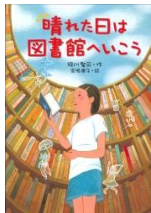
『晴れた日は図書館へいこう』 緑川聖司 作/小峰書店

「朝の読書」で人気(にんき)の作家(さか)が子(こ)どもの頃(ころ)の読(よ)書(しょ)体(たい)験(けん)を語(かた)る好(こう)評(ひょう)シ(シ)リ(リ)ー(ー)ズ(ズ)全(ぜん)3(さん)巻(まき)!