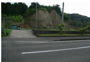
河川増水の際の危険箇所