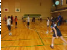
親睦を深められました

8 月 4 日(日)、東郷体育館で親子球技大会を開催しました。今年で 52 回を数える伝統行事で、多くの親・子・職員が参加し、好・珍プレーに歓声が上がると、自治会対抗での親子ソフトバレーに汗を流しました。優勝は五社上、準優勝は古城滑石でした。保体部、集落評議員はじめ関係者の方、ありがとうございました。