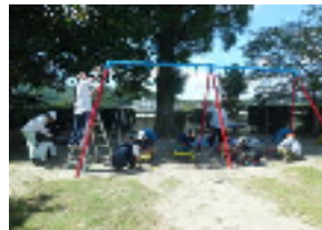
見違えるほどきれいになりました

8 月 18 日(日)の愛校作業、資源回収には、早朝から多くの方々が参加され、草刈りや木の剪定などの環境整備、空き瓶やペットボ