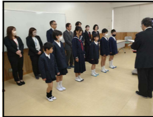
【転入職員と転入児童生徒の紹介】

本校では、「ふるさとを愛し 自ら学び 心豊かにたくましく 夢実現に挑む児童生徒の育成」を学校教育目標に掲げ、「気付き、考え、貢献する」をキャッチフレーズに、教育活動の充実に努めてまいります。特に、この「貢献する」ということについて、4月8日の始業式では、