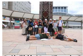
修学旅行の思い出

2日目は、子どもたちが楽しみにしていた「グリーンランド」に行きました。多くのアトラクションを楽しみ、大喜びの子どもたち。とても満足した様子でした。午後からは、熊本総合車両所に行き、新幹線の見学をしました。新幹線の点検や修理など、たくさんのお話を教えてもらいました。