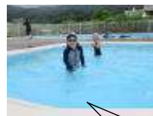
プール, 気持ちいい!!