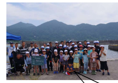
地引網楽しかった!!