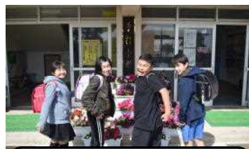
祝 4名の児童が卒業！

リーダーとして、手打小を引っ張って来ました。ありがとうございます！中学校での活躍を期待しています！ Good Luck !