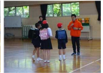
実践的な訓練を通して