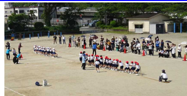
【3年ぶりの綱引き大会です。】

川内小学校の裏にある山の呼称。昔、その一角に青少年の生活の訓練や精神の陶冶を図ることを目的とした修道塾が建てられ、川内小魂の根源を醸成する教育が行われていた。