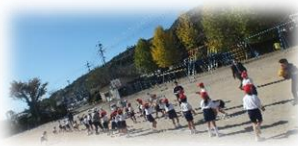
【平佐東小との交流学習】

川内小学校の裏にある山の呼称。昔、その一角に青少年の生活の訓練や精神の陶冶を図ることを目的とした修道塾が建てられ、川内小魂の根源を醸成する教育が行われていた。