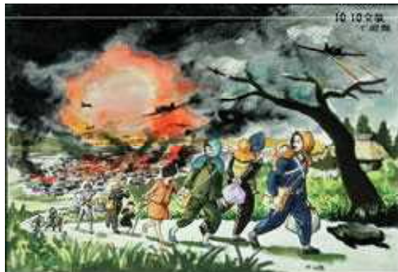
沖縄戦で避難する人々