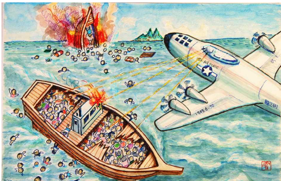
沖縄で島から避難する際、攻撃される様子

今日は、沖縄戦と甬島の学童疎開の関連から、当時の様子をふり返ってみました。数ヶ月の差で、この甬島は、多くの死者が の でることを逃れることができましたが、沖縄のことを考えると、今日の日も、共にその冥福を祈りたいと強く思いました。今日のお話、みなさんはどのように感じるので