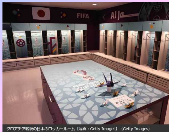
クロアチア戦後の日本のロッカールーム

世界中がサッカーのワールドカップに沸いた12月でした。12月の全校朝会はこのことにふれながら話をしました。子供たちに日本戦を「見た人！」と手を挙げてもらったところ、深夜にもかかわらず、割といて、関心の高さがうかがえました。実際、どの試合もすばらしいものでした。