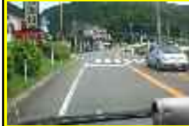
⑨ 山之口公民館前横断歩道