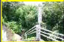
① 鹿子田水量調整場

【危険箇所看板設置箇所】 井堰に下る階段有り。周囲を竹藪で覆われ、人目につきにくい。