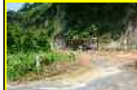
⑤ 大馬越集落黒武者地区

【危険箇所看板設置箇所】 崖が迫り、崩落の危険有り。奥に進むと、歩道から死角になり、人目につきにくい。