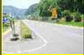
⑦ 国道328号(黒武者バス停付近)