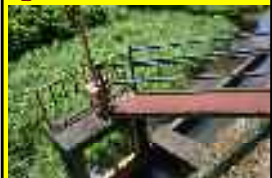
② 山下橋水量調整場

【危険箇所看板設置箇所】 井堰に下る階段有り。周囲を竹藪で覆われ、人目につきにくい。