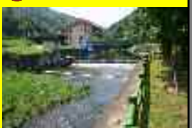
⑧ 山之口公民館井堰