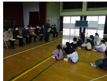
【児童との顔合わせ】

1月15日(木)に、「民生委員と語る会」を実施しました。最初に中津幼稚園と中津小学校の取組についての説明や地域での児童の様子を伺うなど、情報の共有を行いました。