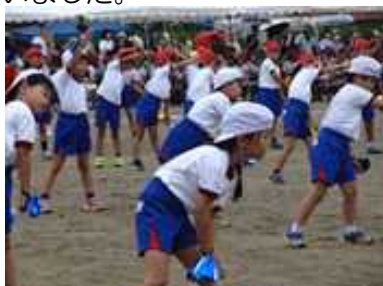
【1年 しんじだい 2023】

第67回秋季大運動会 応援が力になりました！ 今年は3年ぶりに紅白に分かれ勝ち負けを競い、大きな声で歌を歌い、地域種目が入った運動会となりました。子供たちの体力や保護者・職員の声等を大事にし半日開催としました。実際いかがだったでしょうか。また、ご意見をお聞かせください。 さて、残暑厳しい中での練習が続き、熱中症を心配しました。昼休みも応援団やリレー、学年演舞の練習を意欲的にやっていました。9月は運動会一色と言った感じで、本番へ向けて士気が高まっていくのがよく分かりました。 本番は10月1日（日）、天気が心配されましたが、子供たちは練習してきたことを十分発揮できました。家族や地域の応援・声援がパワーとなって、いつもより張り切って競技・演技ができたのではないのでしょうか。1年生にとっては小学校初めての運動会、6年生にとっては最後の運動会となりました。スローガン「燃ゆる感動 永利魂 輝かそう」の通りの運動会となりました。 開催にあたり、PTAの皆様、地域の皆様の御理解と御協力に感謝いたします。本当にありがとうございました。