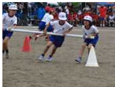
【2年 永利タイフーン】