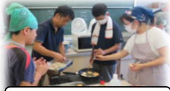
タカエビ料理教室の様子

エビを塩ゆでにししたり、エビカツを作ったり、また、手巻きずしにししたりして、親子でおいしくタカエビを食べることができました。子供たちもとってもおいしそうに食べていました。