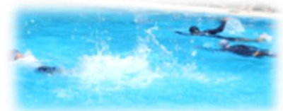
水泳大会 学校保健委員会の様子