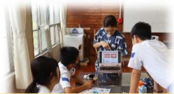
歯科衛生士による歯磨き指導