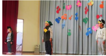
3・4年生 3・4年生の一日