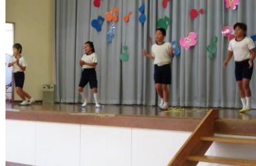
3・4年生 3・4年生の一日