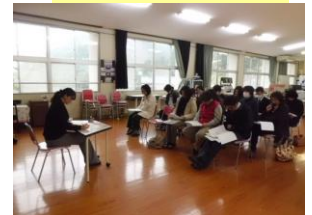
学校保健委員会の様子