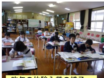
昨年の体験入学の様子

また、特認生の募集は1月の予定です。特認校や体験入学に関心のある方がいらっしゃいましたら、吉川小学校（30-2393）までお知らせください。