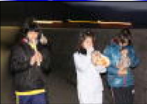
【 法螺貝を吹く女子 】

1月9日、恒例の小中PTA合同空きビン回収が行われました。小中学生とその保護者が、班に分かれて地域の方から提供されたビンを回収しました。