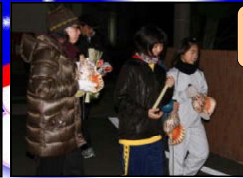
【 中野教諭はマイ法螺貝 】