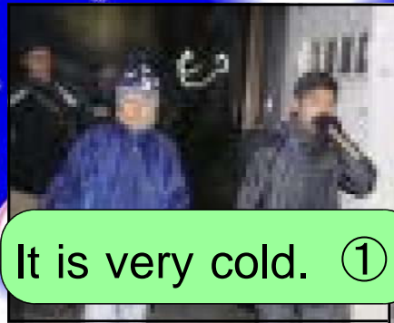
【 練り歩く男子 】