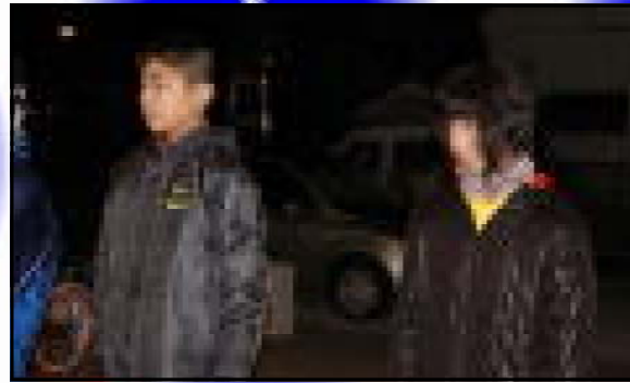
【 出発前のお話し 】

1月7日、恒例の法螺貝ふきが行われました。当日は、数名の子どもと保護者が6時30分から、公民館前を出発し町内を練り歩きました。