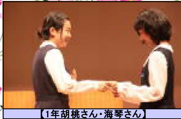
【1年胡桃さん・海琴さん】