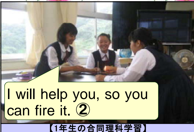
I will help you, so you can fire it. ②