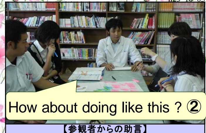
How about doing like this ? ②