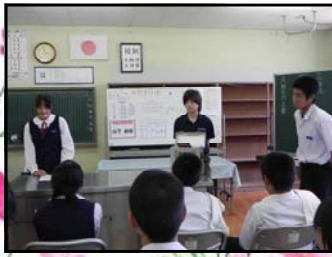
【選挙管理委員の活躍】