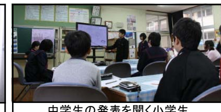
中学生の発表を聞く小学生