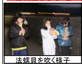
法螺貝を吹く様子

1月7日(土)朝6:30から子ども会主催による法螺貝ふき鬼火焚きが行われました。鬼を追い払う法螺貝等をふきながら町内を練り歩きました。歩き終えた後は、お母さん方手作りのお雑煮で体を温めました。ご協力、ありがとうございました。なお、鬼火焚きは強風のため中止となりました。