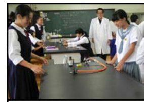
1年理科の合同授業

その後、2年生は社会科、1年生は理科の授業を海星中学校の生徒と一緒に受けました。給食・昼休みも一緒に過ごしました。2回目ということもあり、1学期よりもうち解けた雰囲気でした。この交流は、4月からこの海星中学校で学ぶ生徒にとって、役に立つことと思います。今後は、