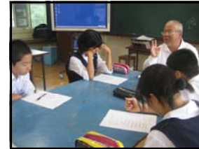
角先生の道徳授業

合同音楽発表会で相互の発表を相互鑑賞します。さらに、学校職員が学習内容や服装・校則等について情報交換を積極的に行い、生徒がスムーズに進めるよう最善を尽くしていきます。何か不安等ありましたら、いつでも本校へ連絡をください。