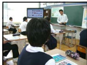
2年社会科の合同授業

合同音楽発表会で相互の発表を相互鑑賞します。さらに、学校職員が学習内容や服装・校則等について情報交換を積極的に行い、生徒がスムーズに進めるよう最善を尽くしていきます。何か不安等ありましたら、いつでも本校へ連絡をください。