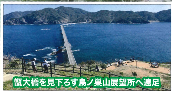
甌大橋を見下ろす鳥ノ巣山展望所へ遠足