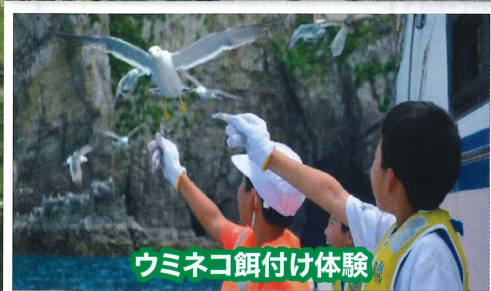
ウミネコ餌付け体験