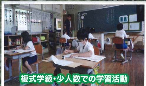
複式学級・少人数での学習活動

実親の負担は月額3万5千円の予定です。（里親への委託料は月額7万円で、そのうち市が月額3万5千円補助します。） また、家族・孫戻し留学については、市が月額3万5千円補助します。 給食費・教材費・学用品などの経費は、実親の負担となります。