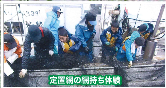
定置網の網持ち体験

里親・家族・孫戻し留学 鹿島小学校に島外から入学並びに転学を希望する児童（小学校1年生～6年生男女）