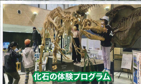
化石の体験プログラム