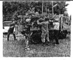
保護者の方々が木を植える様子

また、学校周辺の草刈りをしてくれさ、ている方に「運動会楽しんでる方へ、この声かけられたこともあります。さつい練習もあつたので、か人はもうご思いました。 9月8日に行われた奉仕作業では保護者だけでなく地域の方も参加してくれ、高所での作業や木の枝の伐採など、私達中学生だけではできないことを多くしていただきました。作業終了、さつとしたクワンを見渡すと、運動会を成功させるぞという前向きな気持ちになりました。 運動会前日の会場準備や運動会当日も、多くの方に手伝っていただき、準備では、トラップで机や大きな道具の運搬、10強りのテント立てなど、大勢の方の協力のおかげでわずか一時間で会場の設置ができました。また、運動会当日は、競技の用具準備や撤去、出発のバスや打ち合わせのときやポートしていただき、このように丸山や地域の方々の支えがあったから成功させることができました。