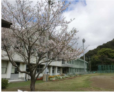
【校庭に咲く満開の桜】