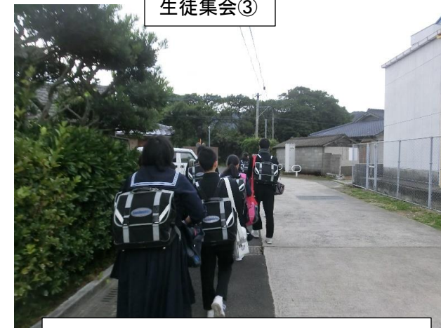
スクールバスから降りて登校の様子