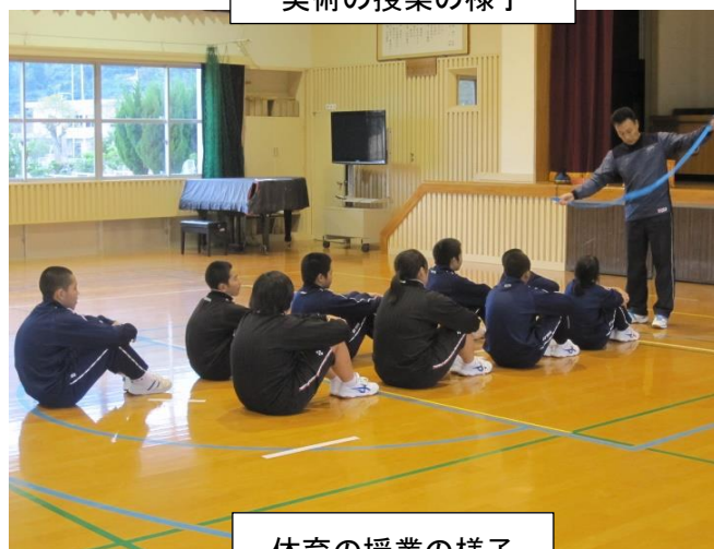
体育の授業の様子