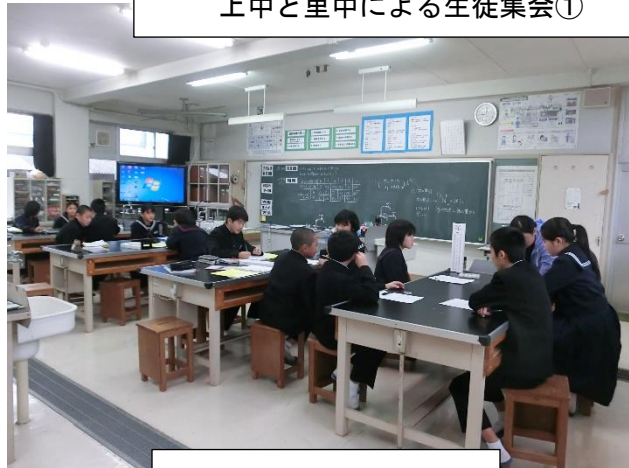
理科の授業の様子