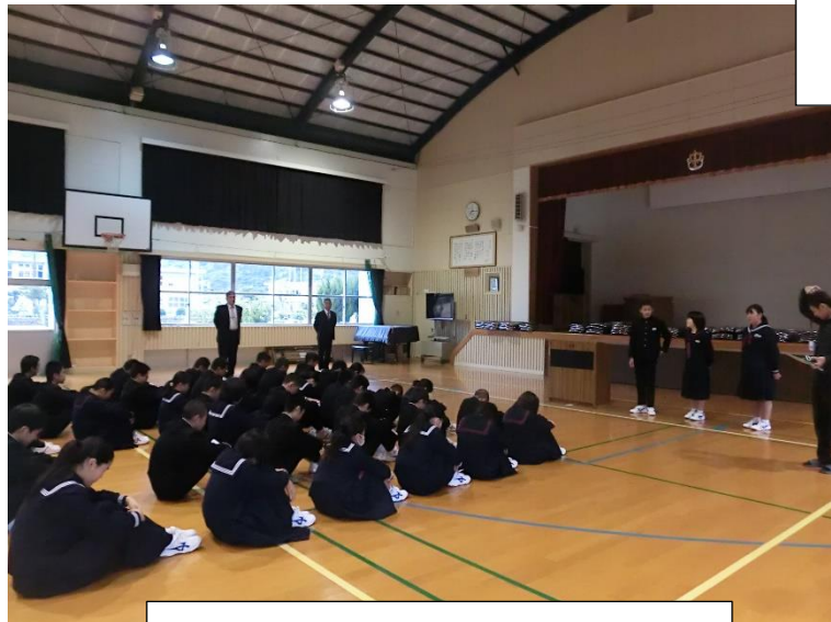
上中と里中による生徒集会①