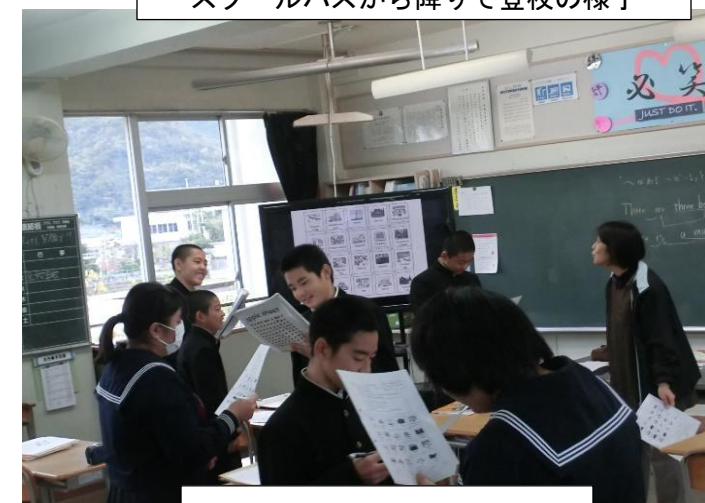
英語の授業の様子