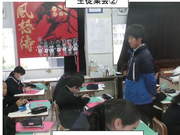
美術の授業の様子