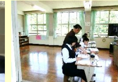
【小中の教諭で授業づくり】 【発問の工夫】 【個別のフォロー】