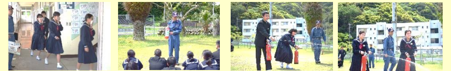
【速やかに安全に移動できました】 【消火器も落ち着いて使用できました】

4月13日に、火災を想定した避難訓練が行われました。上甕分駐所の隊員の方々から指導をしていただきました。校庭までの安全な経路を通して、速やかに避難することができました。また、消火器の使い方も指導していただきました。上甕分駐所の皆様、ありがとうございました。