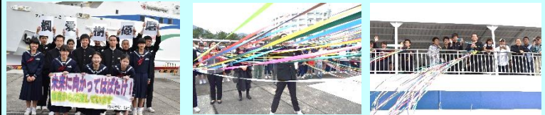
【ついに島立ち】 【希望に向けて出発！】 【また会う日まで】

慣れ親しんだ人々との別れに、淋しい気持ちは否めませんが、その一方で、自己実現に向けて大いなる一歩を踏み出す成長した姿を誇らしく思います。次のステージでの活躍を、心から願っています。行ってらっしゃい！