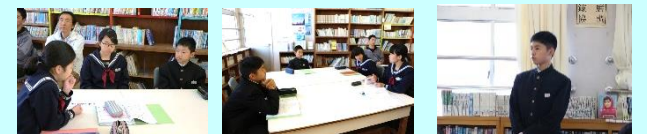
【活発な意見交換が行われました】【新しいアイディアも】