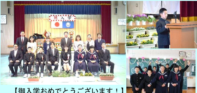
【御入学おめでとうございます！】