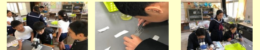
【顕微鏡で何が見える?】 【プレパラート完成!】 【中学生が優しく教えます】