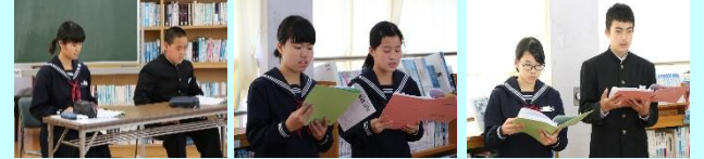
【司会進行役】 【各専門部から活動報告と計画の発表】

4月18日生徒総会が行われました。昨年度の反省を生かし綿密に練られた内容は、ひと味もふた味も違いました。「上甕中の良さを地域に発信するにはどうしたらよいか。」というテーマの話し合い活動を中心に据え、とても活発な意見が交わされました。特に、地域のボランティア活動に、できるだけ参加しようという意見や、そのためのアイディアなど、感心させられるものが多く、これからの生徒会の取組が、とても楽しみになりました。