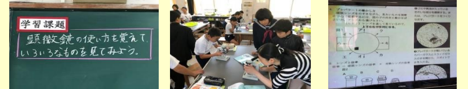
【本時の学習課題】 【正しく使えるかな?】 【ICTも活用】

6月29日に予定されている小中一貫教育研究公開に向け、本年度もますます小中一貫教育を通じた学力向上に取り組んで参ります。