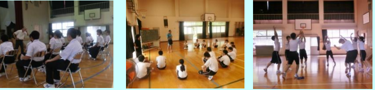
【1学期終業式】 【ソーラン節始動】 【暑くても精一杯練習】

7月20日の終業式から早1ヵ月が経ちました。夏休みも残すところ10日ほどとなりましたが、これまで大きな事故もなく、家庭や地域の教育力に感謝しているところです。 また、生徒たちは、夏休み中も毎日のように学校に登校し、部活で汗を流しながら、運動会や上中祭の練習に励んでいます。2学期最初の大きな行事、幼小中合同運動会に向けては7月の体育の授業で既にソーラン節の練習が始まっております。乞う御期待！