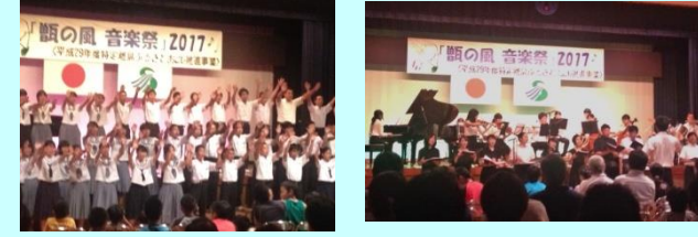
【はじける若さ!】 【ルプールの10回目の参加】