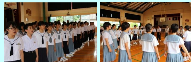
【里中との合同練習】 【パート練習も真剣】

7月16日(日)に里公民館で「甕の風音楽祭」が行われました。里中との合同練習を経て臨んだ本番では、1校だけでは決して得ることのできない迫力ある歌声で会場を沸かし、昨年とはまたひと味違う「島人ぬ宝」と「いつか帰ろう心のふるさとへ」を聴くことができました。 今年は東市来中の吹奏楽部が招待され、ストーリー仕立てでプログラムが進む工夫された演奏を聴かせてくれました。恒例のアンサンブル・ルプールの息のあった演奏には、会場を訪れた皆が魅了されました。来年は、どんな演奏を聴かせてくれるのか、今から楽しみです。