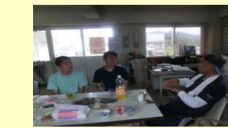
【従業員の方ともうち解けて】