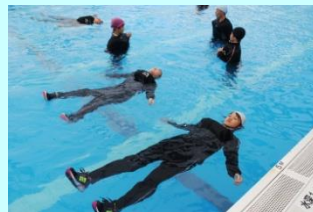
【いざという時は浮いて待つ】

6月19日(月)は水難訓練、7月5日(水)は水泳記録会が行われました。水難訓練には昨年度に引き続き、串木野海上保安部から4名の方が講師で来校し、水難事故から命を守るための具体的な方法等を教えてくださいました。また、水泳記録会には、15名の保護者が参観。賑やかな声援を送ってくださいました。水球や種目別リレーには、先生たちも参加し、レースを盛り上げていました。特に3年生に自己記録を伸ばした生徒が多く、上級生らしい泳ぎっぷりに感心することでした。さすが3年生です。