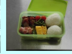
【美しい仕上がりに！】