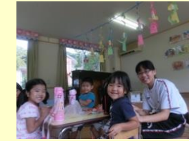
【幼稚園の子どもたちもすっかりなついていきます】