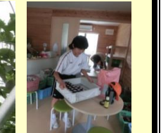
【パッションフルーツの収穫と加工】