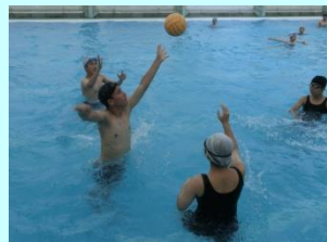
【水球也大盛り上がり！】