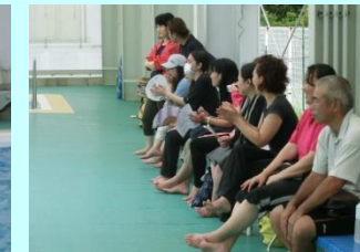
【賑やかな保護者の応援】