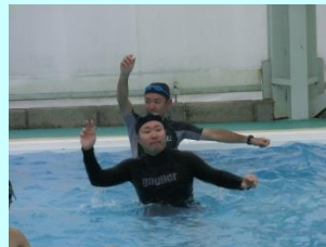
【恒例のエビカニックス】