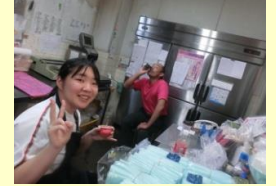
【華やかな店の裏側は、とっても大忙しです】