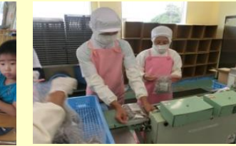
【食品は衛生管理が第一！】