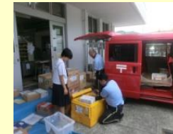
【郵便局にはたくさんの小包や封書が届きます】

7月6日(木)、7日(金)の2日間、職場ウォッチングと称して職場体験学習が実施されました。2年生6名が、それぞれ希望する計5つの事業所にお世話になりました。中甌郵便局、甌フルーツ園、中津幼稚園、甌島漁業協同組合上甌支所、POP、1と業種も様々です。学校ではできない貴重な体験をさせていただきました。また、休憩時間や昼食時間の職場の方々との話りも、とても良い思い出になったようです。生徒たちにとって今回の体験は、これからの自分自身の進路選択をしていくうえで、とても大切なヒントになることと思います。関係者の皆様に心から感謝申し上げます。