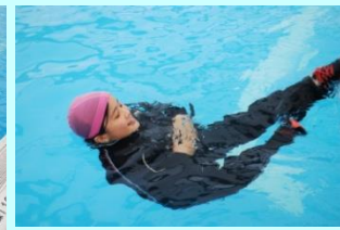
【ペットボトルも活用】