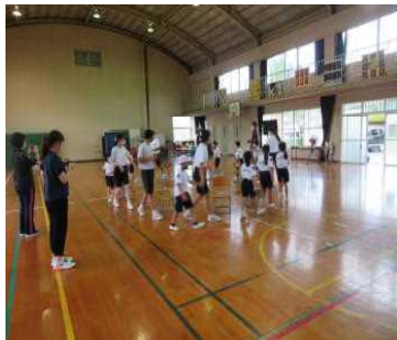
1・2年生と中学3年生の交流