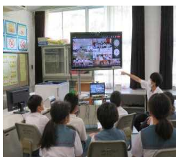
5・6年生と中学1年生の交流

祁答院中学校校区の小中一貫教育は、薩摩川内市の中でも一番古い歴史を持っています。今年は上手小学校が祁答院中学校校区の研究をリードする担当校です。