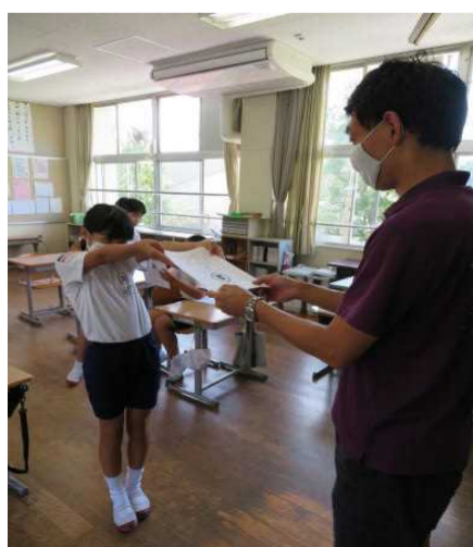
嬉しそうに通知表を受け取る