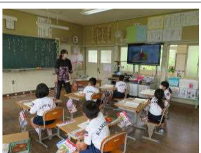
2年生 コンピュータを使って国語の学習