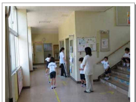
内科検診 ～お利口さんにできました～