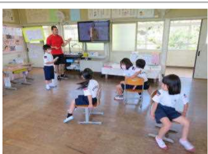
1年生 楽しい英語ゲーム