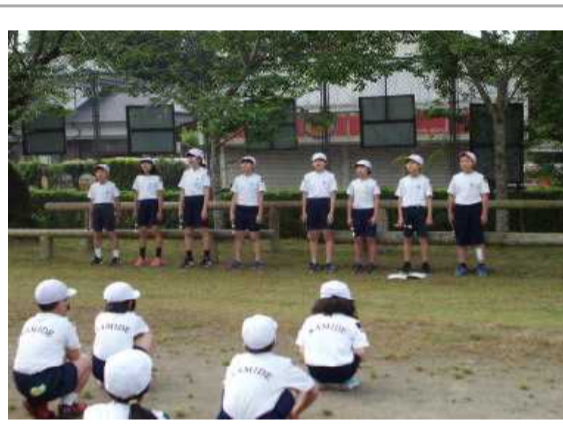
5・6年生による児童集会 ～歌声・リコーダーの音色、お見事～