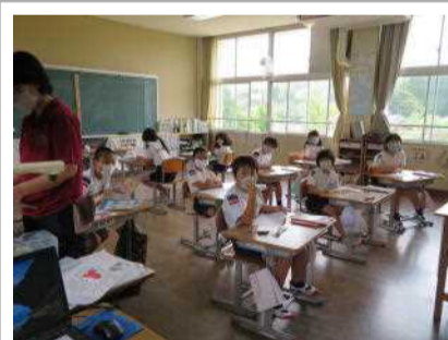
3・4年生 音読頑張るぞ