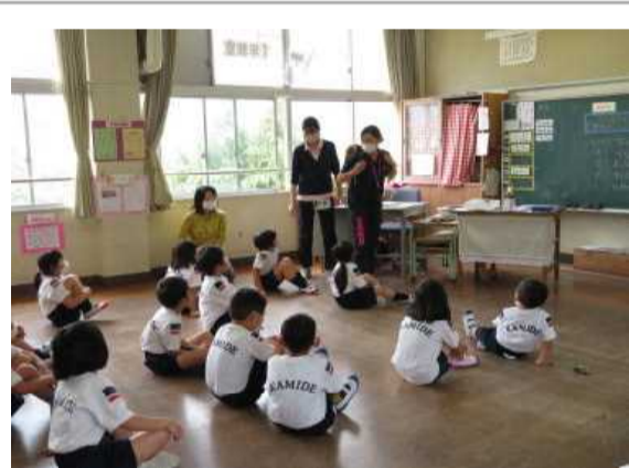
不審者対応避難訓練 ～どうすればいいかわかったよ～

学校では、コロナウイルス感染予防策を最大限とりながら通常授業を再開しています。休業で遅れた学習も気になります。小規模校の特性を生かし、個に応じた指導を大切にしながら、スピード感を持って進めていきたいと思えます。