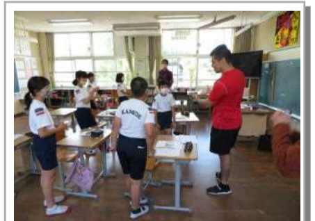
5・6年 〇〇〇先生と楽しく英語学習