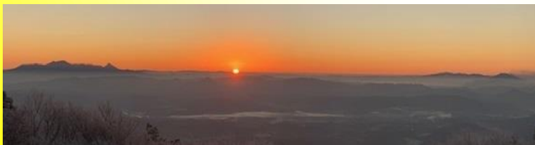
(初日の出「紫尾山頂」)

では、私は、何を入れたかという、・・・言葉や漢字ではなく、発想は豊かな方がいいと思えます。今年、2020年。ニーマルニーマル → 二重マル二重マル → ◎◎。〇の中に〇を入れて◎にしました。◎と言えば、小学校の通知表では、「◎：たいへんよくできました」という学校が多いと思えます。今年の終わりに、1年間を振り返って反省したとき、「一年の計」と同じであることがベストだと思います。海星中の生徒が、今年の終わりに「◎の年」「たいへんよく頑張った年」だったと言えるようにしていきたいと思えますので、2020年もよろしくお願ひします。