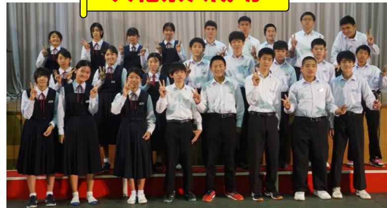
※裏面も御覧ください。