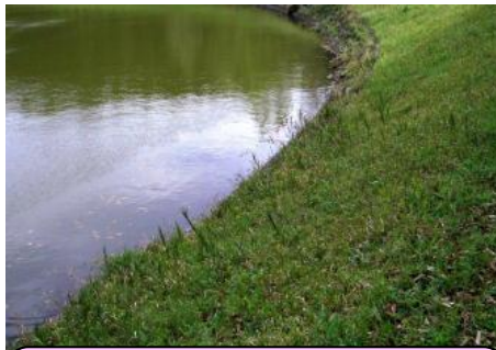
山口のため池 池の縁が滑りやすく危険