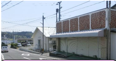
旧マルミ屋前のT字路(正門前) 見通しの悪い狭い道路