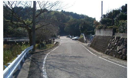
坂出橋交差点の坂道 見通しが悪く曲がりくねった坂道