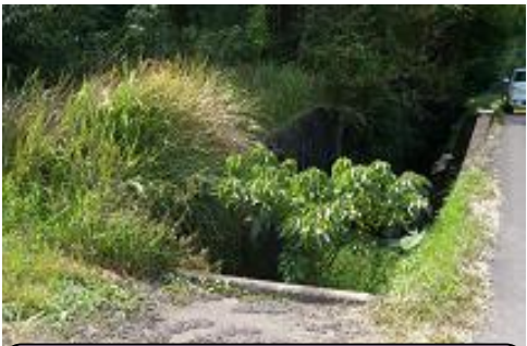
セルフスタンド付近用水路 溝が深く草が茂っている。