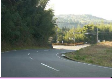
旧富士通工場横の道路 草木が茂り、見通し悪い。下り左側は落ち葉が溜まり自転車はスリップしやすい