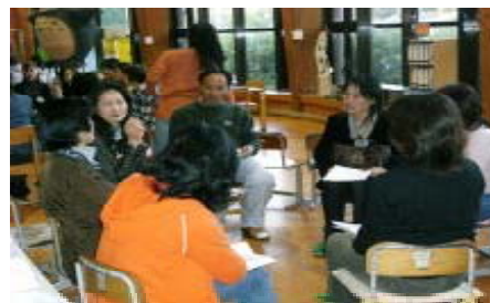
〔少人数グループでのフリートークの様子〕