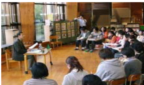
〔学校保健委員会での講演の様子〕

エ 9月から毎月「生活リズムチェック週間」を設定し、チェックカードを用いて自己目標を立てさせ、幼稚園と下学年は保護者と共に上学年は自分で生活リズムチェックを行った。