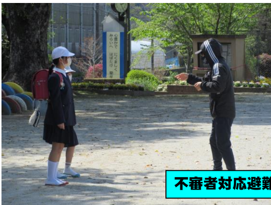
不審者対応避難訓練 (10日)

藺牟田小学校の閉校までの最後の1年がスタートしました。児童代表の言葉は、5年生の〇〇〇〇さんが務めました。堂々としたとても立派なスピーチでした! 有言実行でがんばりましょう。