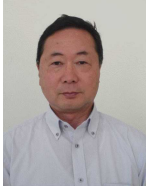
初任教指導教員 (前亀山小校長)