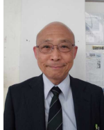
スクールカウンセラー (臨床心理士・ 公認心理師)