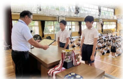
【表彰を受ける樋脇一心会のメンバー】