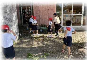
【台風後の落ち葉や枝の後片付けをしている様子】