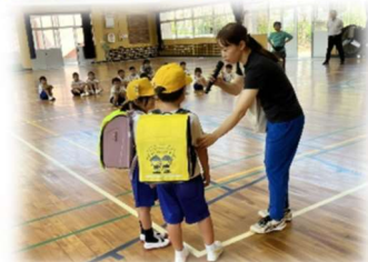
【駆け込み訓練の様子】