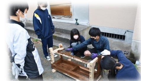
仕上げの色塗りをしている様子

市比野温泉地域活性化協議会の方々を講師に、卒業制作としてベンチづくりを行いました。のこぎりやインパクトドライバーなど、日頃使わない道具を使っての制作だったので、はじめはなかなか上手く使えませんでした。ただ、さすがは6年生、講師の方々の丁寧なアドバイスもあり、後半はスムーズに作業ができていました。できあがったベンチは、市比野の町に置かれ、いろいろな方が使用することになります。みんなと力を合わせてつくり上げたベンチ、市比野のまちにも貢献できて、大満足の6年生の子供たちでした。地域活性化協議会の皆様、ありがとうございました。